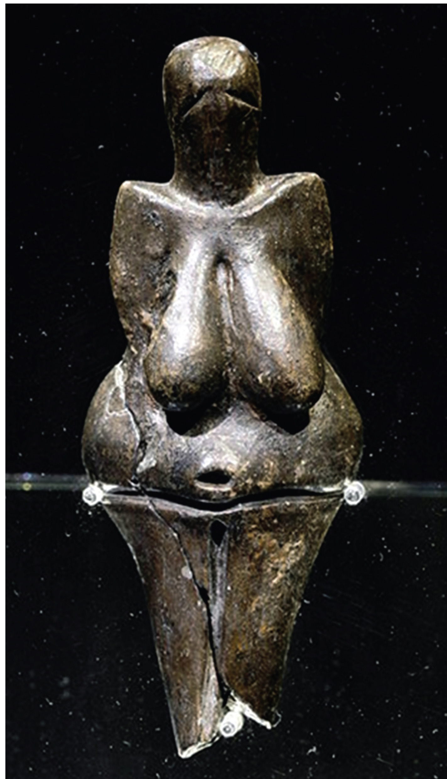
Fig.1 - Venere di Dolni-Vestonice, Moravia (24.000 a.C.)