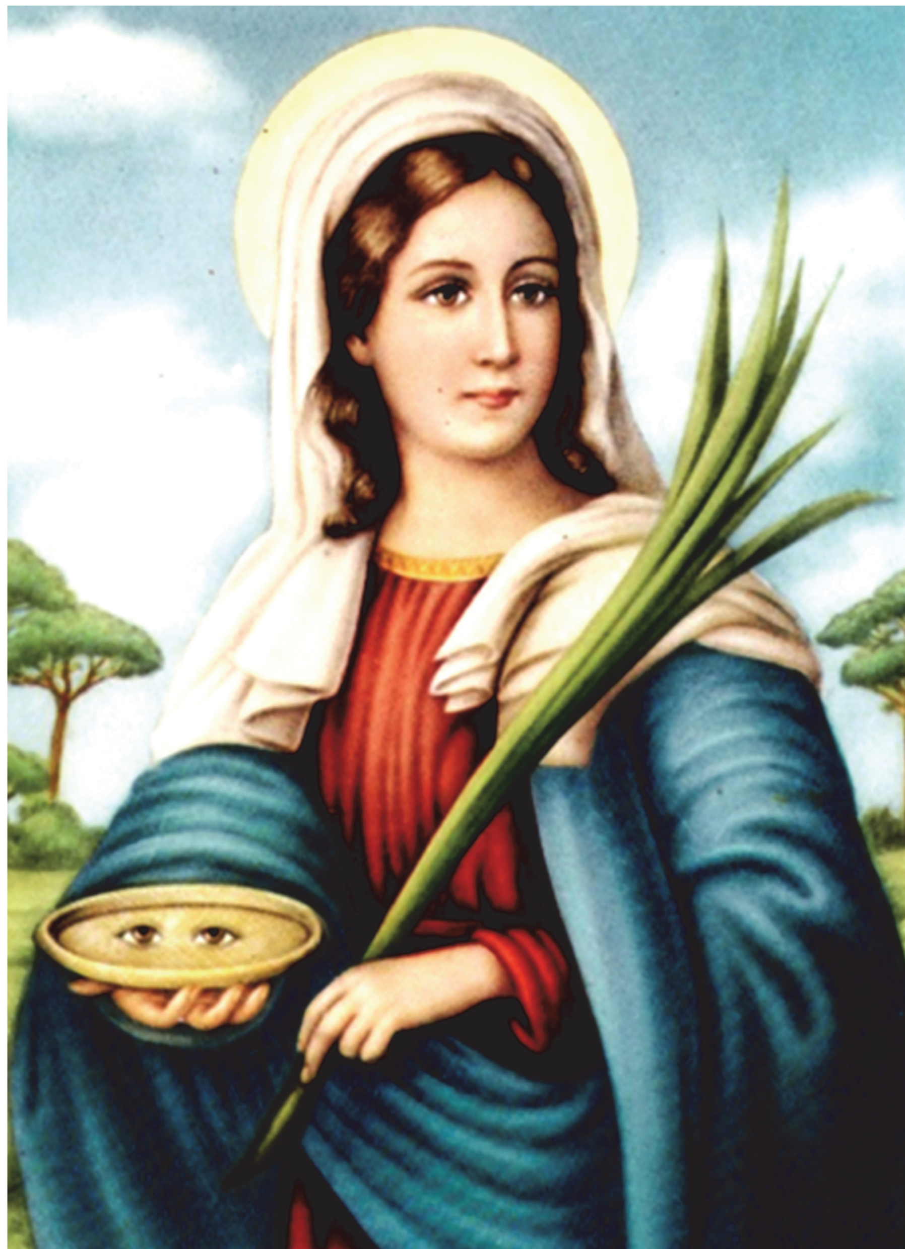
Fig.2 - Santa Lucia