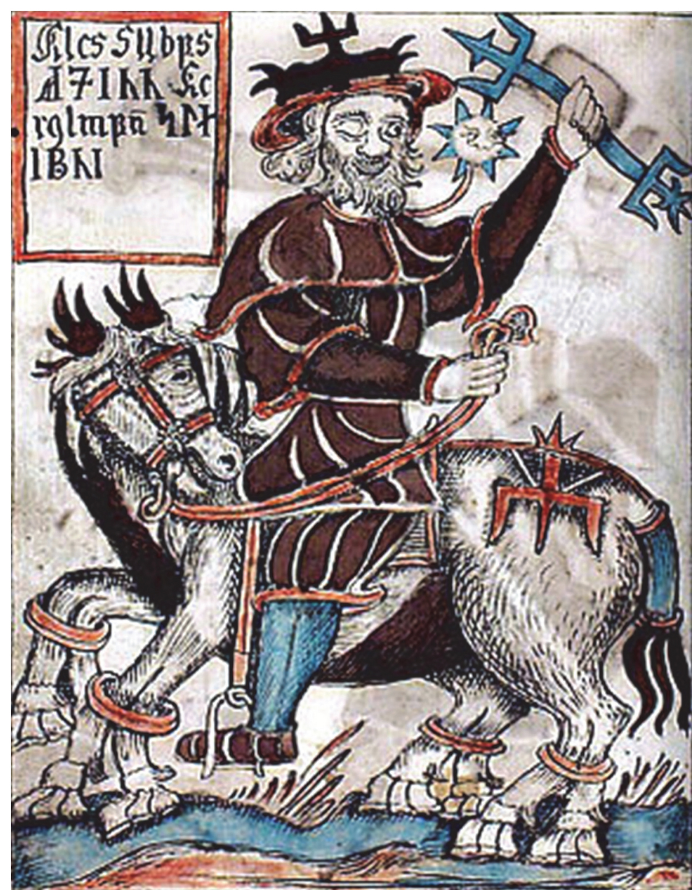
Fig.3 - Odino in sella a Sleipnir. Illustrazione di Olafur Brynjulfsson dal manoscritto islandese del XVII secolo Samundar og Snorra Edda. ( https://upload.wikimedia.org/wikipedia/commons/thumb/1/11/Odin_riding_Sleipnir.jpg/290px-Odin_riding_Sleipnir.jpg )