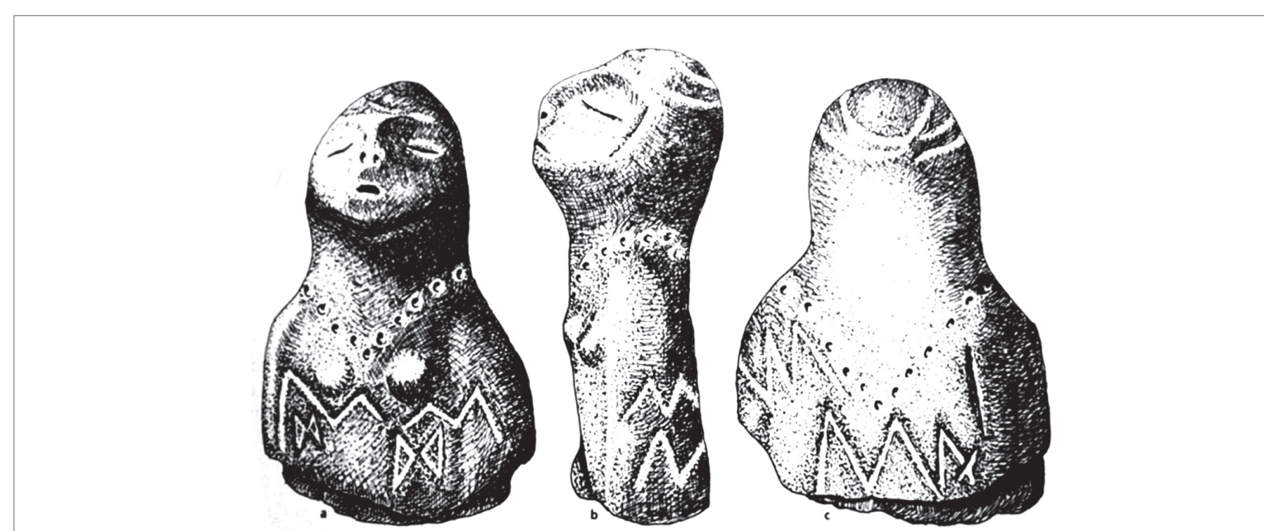
Fig.4 - Statuette in terra cotta - 5300 a.C., da Passo di Corvo Puglia da: Marija Gimbutas "Il Linguaggio della Dea"