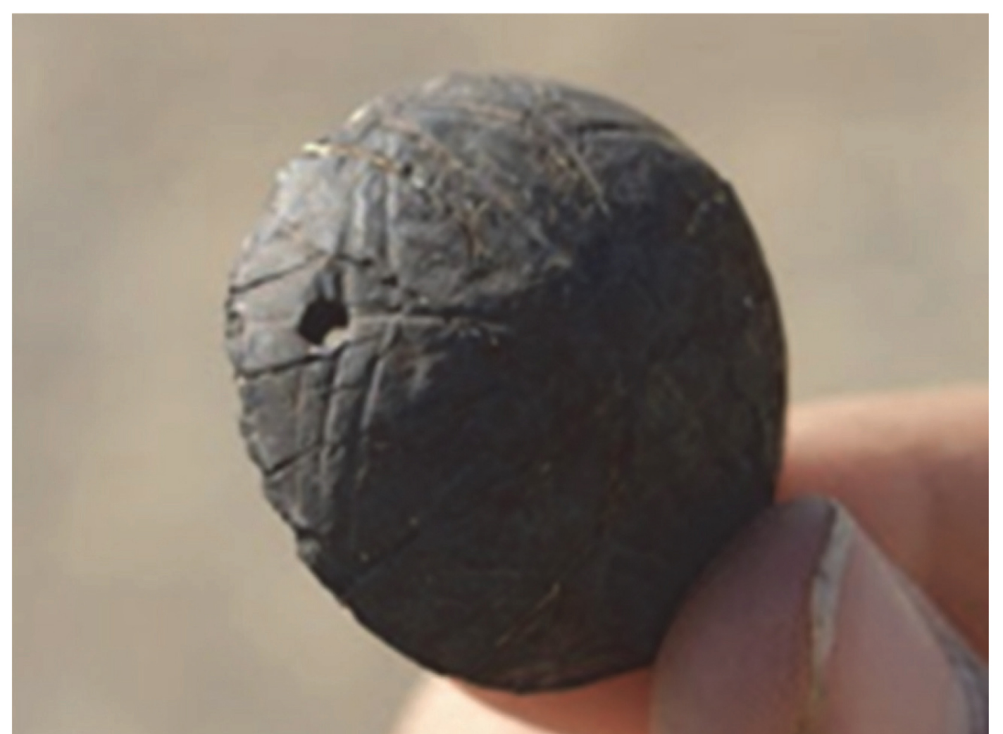
Fig.6 - "La Sciamana dall'occhio d'oro" (sinistro) 2.900-2.800 a.C. necropoli di Shahr-i Sokhta, Iran, Battriana- Afghanistan