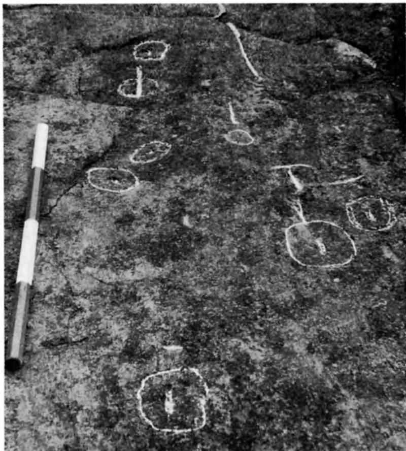
Fig. 43 — Bagnou: lastrone con segni di probabile significato sessuale.

legghenda locale dice che questa roccia «fiorisce» la notte di S. Giovanni (ossia il 24 giugno).