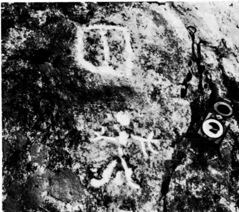
Fig. 44 — Rocciaglia: figura umana fallica e probabile simbolo sessuale femminile.

gna (q. 1200 m., misure m. 1,50 x 3 — esposizione ad Est — O. Coisson, 1960).