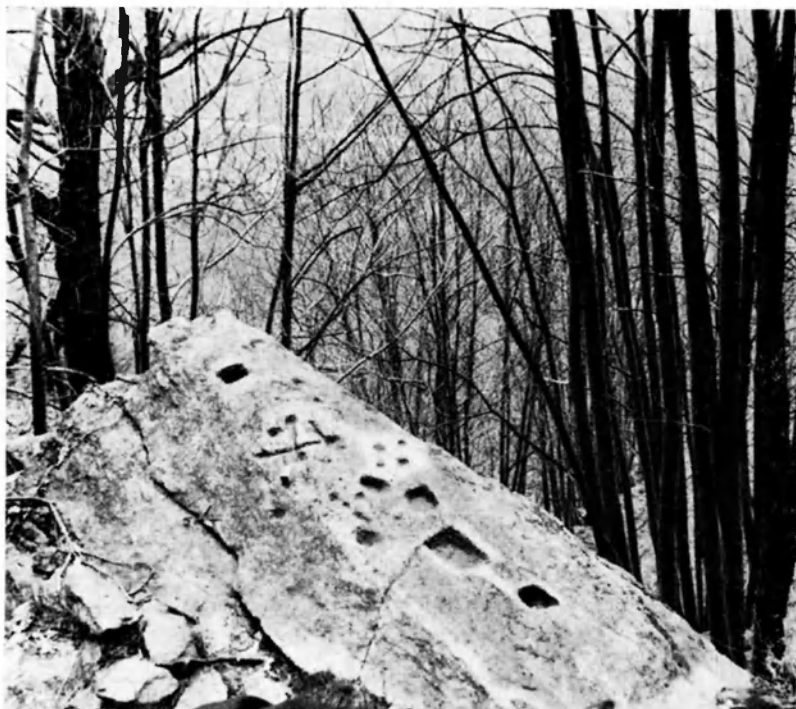
Fig. 41 — Gruppo del Bonnet: roccia con coppelle, canaletti e vaschette rettangolari.

1) Masso del Ciastel - in posizione dominante ad Est su uno sperone di roccia che chiude l'ingresso dell'alta valle, e su cui sorse, nel Medio Evo, la dimora dei feudatari locali (Bigliori di Bobbio), da cui il nome della località Ciastel - Castello. N. 20 coppelle, talune delle quali con canali (O. Coisson, A. Santacroce, F. Jallà, 1963).