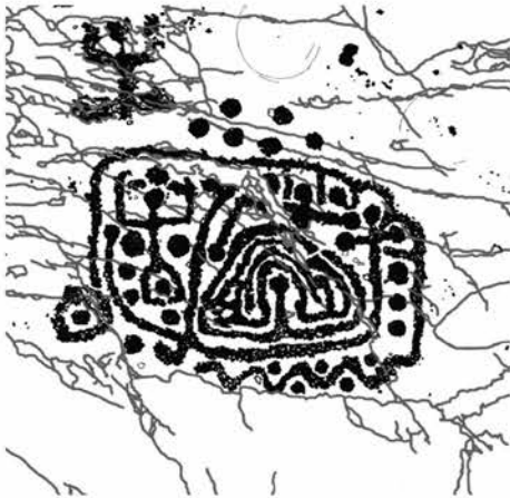
Fig. 50 Pagherina R. 8. Figura enigmatica, senza confronti, composta da meandri, linee, serpentine, coppelle ed una figura umana orante. Probabile fase finale dell'età del Bronzo.

Nel medio versante sinistro, lungo le pendici che si aprono come un ventaglio inclinato sul perno di Capo di Ponte, vi è il più esteso e denso parco istoriato della valle: dagli alti siti di Paspardo, a nord (sino ai 1000 m slm) gradualmente degradanti in quelli centrali di Cimbergo (sino ai 650 m slm) e meridionali di Nadro (ca 450m slm) si sviluppa un contesto che pare avere il suo cuore proprio nell'area più bassa e