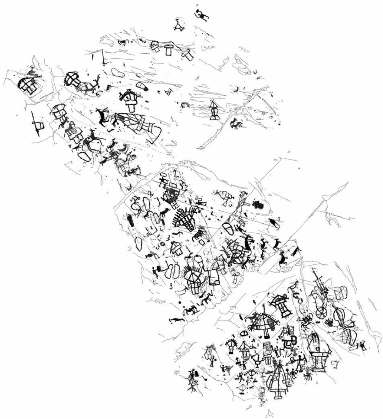
Fig. 49 Pagherina R. 16. Rilievo integrale di una superficie molto ricca con numerose immagini di capanne, impronte di piede e cavalli. Di grande pregio, in alto, un cervo cavalcato. Varie fasi dell'età del Ferro.