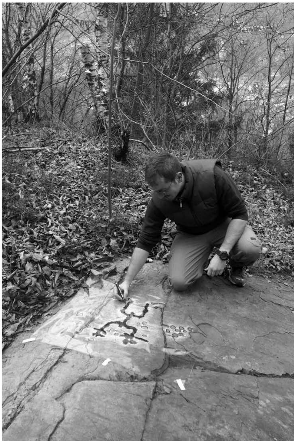
Fig. 53 Dos del Pater R. 5. Momento del rilievo dell'orante a grandi mani.