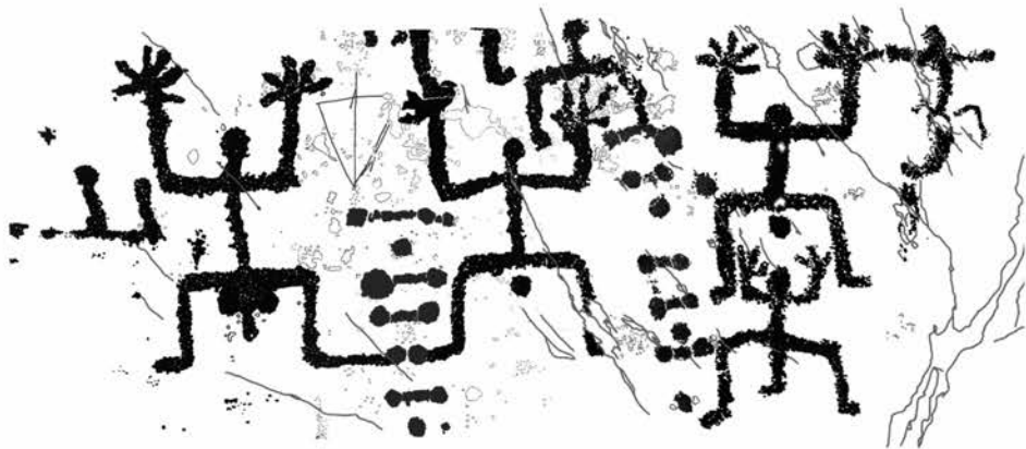
Fig. 51 Pagherina R. 1. "La famiglia": figure oranti a grandi mani con la donna al centro, l'uomo sulla sinistra e una coppia di figure più piccole (maschile e femminile) sulla destra. Probabile fase tardo neolitica.

degli stessi, in un luogo di confine artistico, senza una sua precisa identità, ma ci siamo presto ricreduti: il sito è indubbiamente partecipe dei menzionati caratteri di versante e non ha macroscopici stacchi cronologici e iconografici rispetto a Naquane e Campanine, ma un'osservazione attenta coglie tutta quella serie di dettagli che ne stabiliscono caratteri peculiari: innanzitutto la densità istoriative di alcune superfici, letteralmente colmate di figure, quindi la quantità e l'originalità tematica, non solo di alcuni soggetti, ma soprattutto delle varianti spesso ripetute dei temi più ricorrenti.