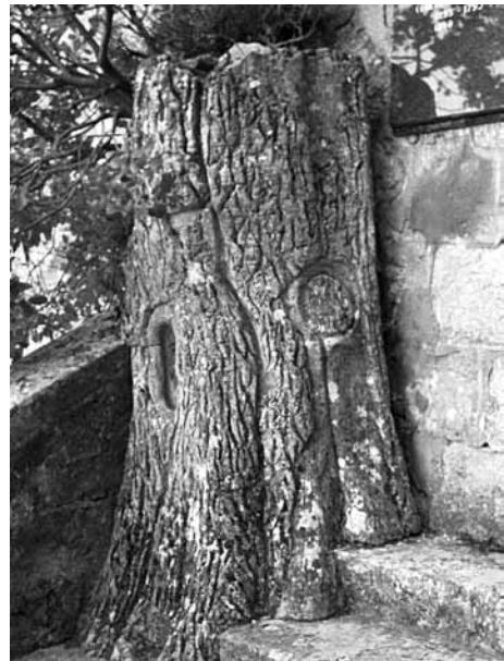
Fig.16 - Oratoire dont la niche est remplie de petites pierres