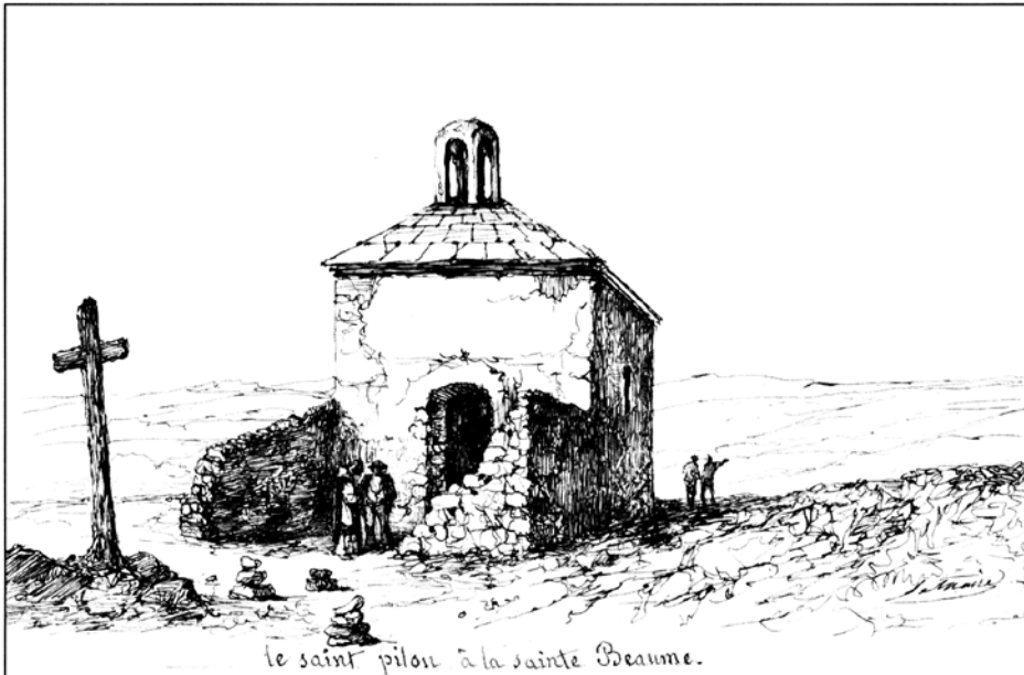
Fig.4 – Le Saint Pilon d’après un dessin de P.Letuaine au XXe siècle - d’après Froeschlé-Chopard 1994 Noter les castellets au premier plan

enterré Maître Jacques, figure très effacée au regard de la notoriété de la sainte. Pour les garçons, Marie-Madeleine est initiatrice de la sexualité en tant que « prostituée » 8 , modalité de rapport à l’autre sexe que de nombreux compagnons ont expérimenté pendant leur voyage. Cependant, à la Sainte Baume, « il s’agit, sous l’œil de Marie-Madeleine, de bien finir sa jeunesse et de ritualiser son passage à la maturité » (ADELL-GOMBERT 2006, p. 133) : bref, de « faire une fin », c’est-à-dire d’aborder les questions de la nuptialité et de la procréation 9 . Moins affectés par les changements de leur corps que les filles, les garçons éprouvent plus de difficulté à rendre visible leur progression vers l’âge adulte d’où des stratégies d’ascension et de confrontation au sauvage. Ils ne peuvent réaliser ces passages et ces transformations que par la présence d’un intercesseur. Marie-Madeleine représente cet « être-frontière » parce qu’elle s’est ensauvagée elle-même (FABRE 1986).