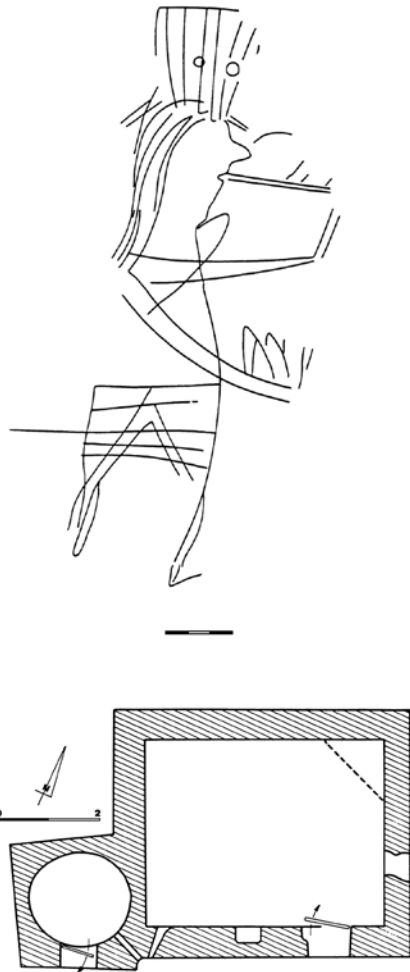
Fig.5 – Graffiti relevé dans un cabanon de Cuges-les-Pins sur l’adret de la Sainte-Baume. Plan du cabanon avec son puits accolé.

Sans-Pareil où ils récupèrent quelques rameaux en guise de souvenir mais surtout, certains d’entre eux inscrivent leur nom derrière les oratoires qui scandent le chemin et qu’ils appellent « autels ». Ce tracé comme preuve de leur passage est appelé « remarque ». Abel Boyer, déjà cité, Compagnon Maréchal Ferrand, écrit qu’il est passé par Saint-Maximin puis est monté à la grotte et jusqu’au Saint-Pilon : « il est environ deux-heures de l’après-midi quand j’ai terminé mon inscription derrière l’un des deux autels qui précèdent le Saint-Pilon et je descends à travers la forêt » (BOYER 1947, p. 140) (Fig. 6). Certaines remarques sont encore visibles, sur les murs de la basilique de Saint-Maximin (Lorrain la franchise 1828 ; Lionnais le Bien aimé compagnon charron le 15 mai 1852, etc.) (MONTENAT et GUIHO-MONTENAT 2009). Sur les