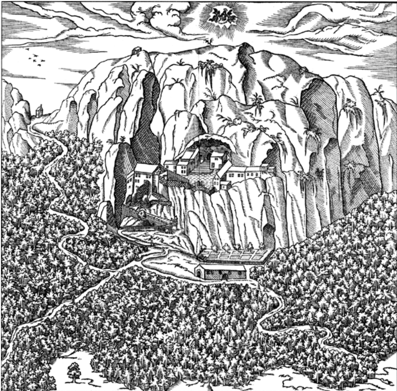
Fig.3 – La Sainte Baume d'après une gravure de 1570 – d'après Froeschlé-Chopard 1994