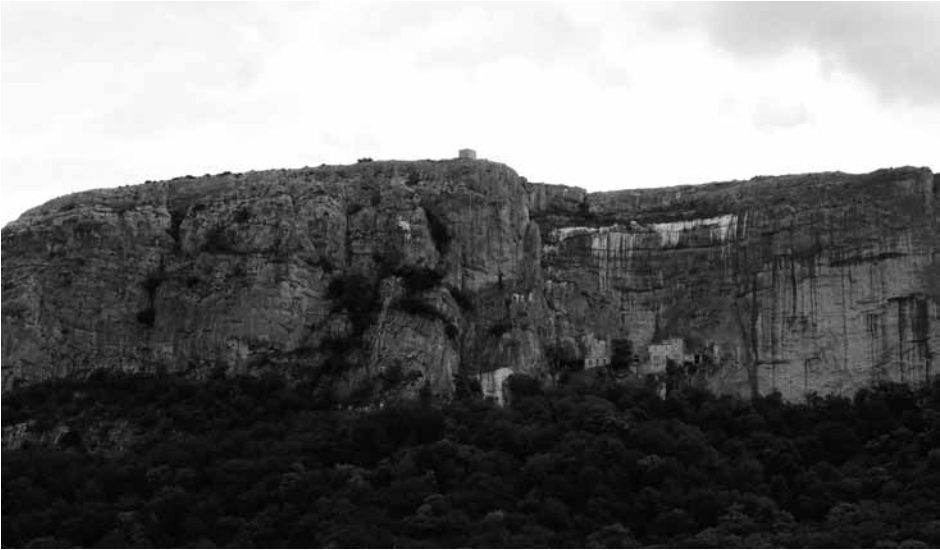
Fig.2 – La Sainte Baume : forêt et falaise. On voit les locaux de l'entrée de la grotte et le Saint Pilon au-dessus de la crête