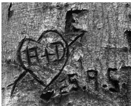
Fig.7 - Un hêtre dont la base du tronc est entièrement couverte d'inscriptions gravées