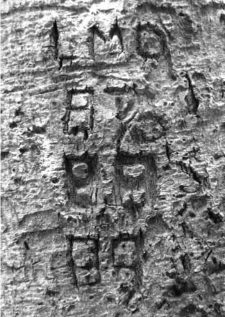
Fig.20 – Initiales avec dates de plusieurs passages (1987, 1988, 1989)

prennent le temps d'une flânerie et qui officialisent les raisons de leur passage sur un support non avénu. Le chemin des Roys est celui des supports culturels, des autels que l'on grave et où les inscriptions se pérennisent mais aussi un chemin où les chênes pubescents ne sont pas propices à la gravure. Le chemin du Canapé propose des supports naturels, des troncs de hêtres pour des messages jugés éphémères. Le premier chemin semble attester le passage des personnes seules, l'autre accueille manifestement les couples. L'ascension jusqu'au Saint Pilon à partir de la grotte réunit ces deux comportements puisque Compagnons, personnes seules et couples s'y rendent également pour y accomplir remarques ou invocations sur et à partir de l'élément minéral.