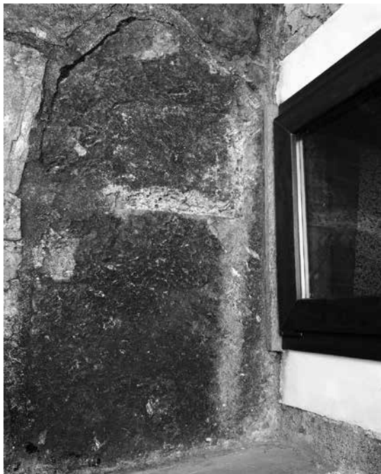
Fig. 1 - La stele Piombarda 1 nella sua posizione originale fuori dall'ingresso laterale della chiesa di San Giovanni di Teglio

Negli ultimi 15 anni in Valtellina sono state riportate alla luce nuove stele che si sono aggiunte a quelle rinvenute precedentemente che, per lo più, sono conservate nell'Antiquarium Tellinum di Palazzo Besta a Teglio (SO). Anche se si riscontrano notevoli somiglianze con le stele del gruppo della Valcamonica, lo studio dei monumenti della Valtellina ha rivelato alcune differenze iconografiche e cronologiche, in particolare nelle stele considerate femminili, cioè quelle con oggetti di ornamento. Nella comunicazione verranno presentate alcune nuove scoperte in loc. Piombarda di San Giovanni a Teglio e alcune rivisitazioni di stele ben conosciute (Caven 1 e 2, Tirano-Lovero). Il riesame, basato soprattutto su nuove indagini fotografiche e nuovi rilievi a contatto, ha mostrato alcune novità sorprendenti che includono la rotazione di uno dei monumenti e il ripetuto cambio di genere che si può osservare in queste stele.