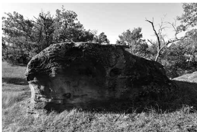
Fig. 6 - Abrigo de las Manos.