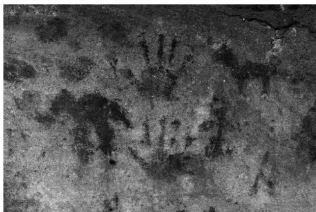
Fig. 9 - Abrigo de las Manos, detalle central.