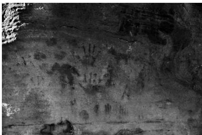
Fig. 8 - Abrigo de las Manos, detalle.