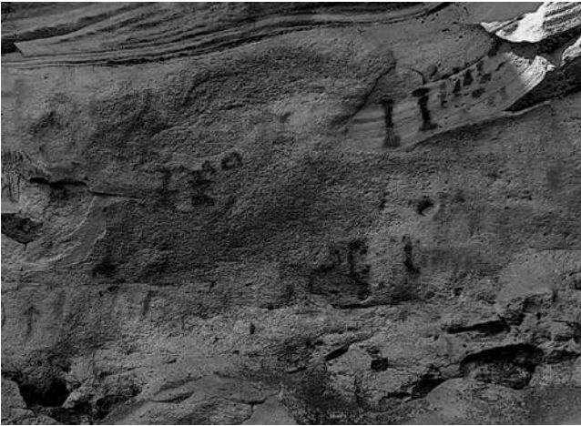
Fig. 3 - Abrigo de La Lastra, detalle central.