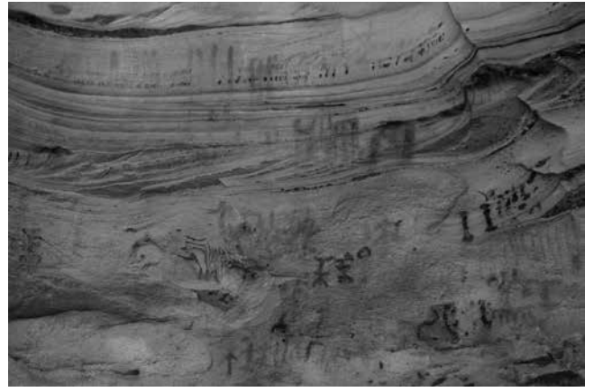
Fig. 2 - Panel pintado del Abrigo de La Lastra.