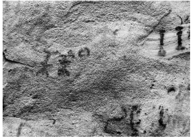
Fig. 4 - Abrigo de La Lastra, detalle.