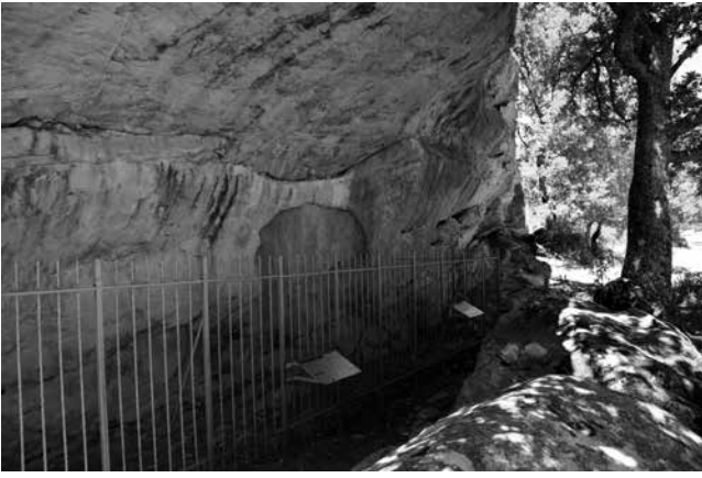
Fig. 1 - Covachón del Puntal y Abrigo de La Lastra.