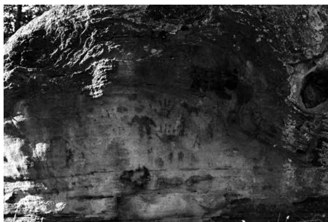
Fig. 7 - Panel pintado del Abrigo de las Manos.