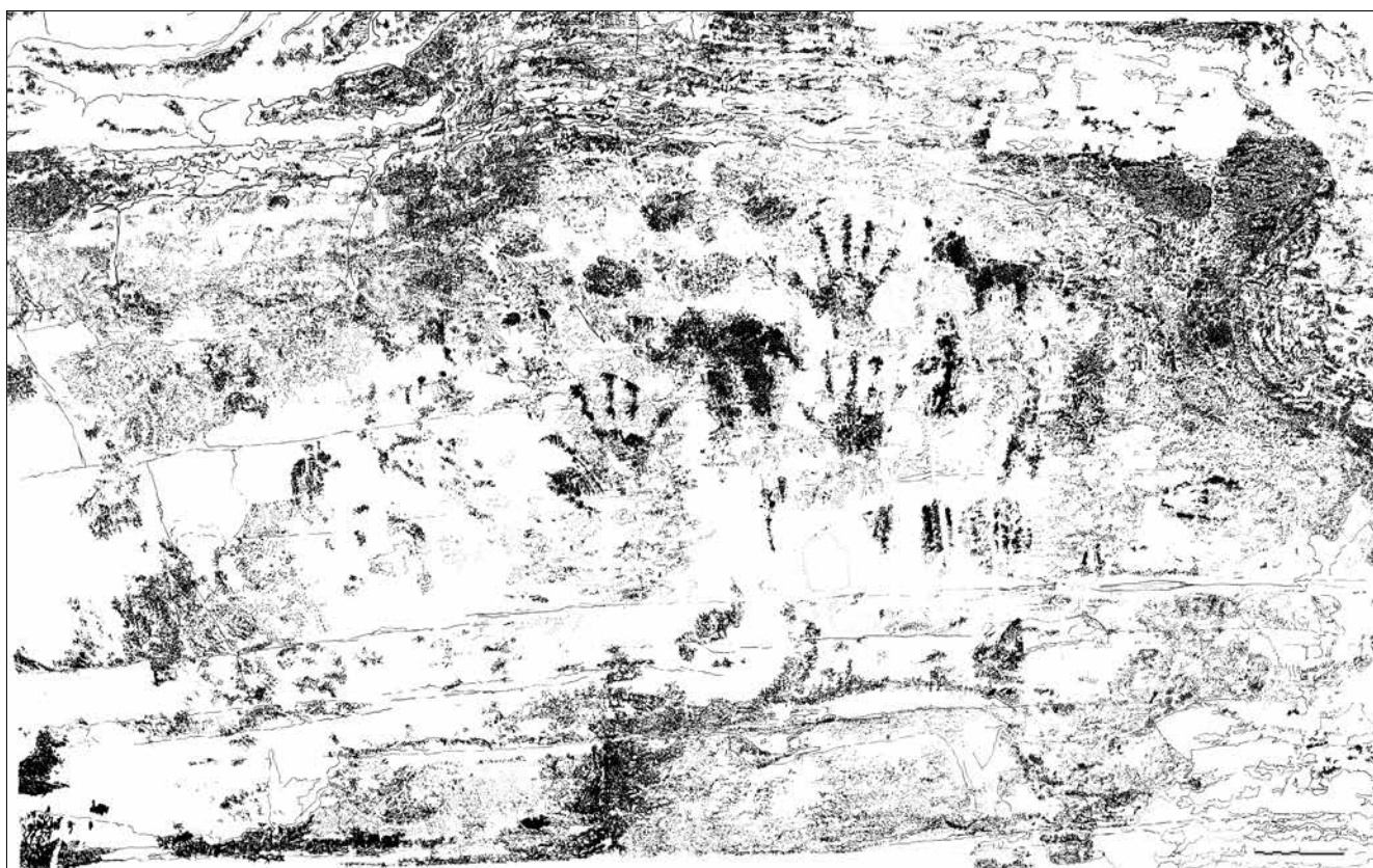
Fig. 10 - Abrigo de las Manos (JAGB 2021).