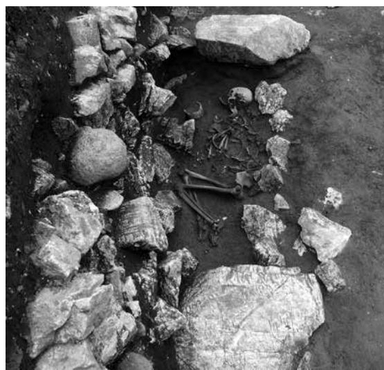
Fig. 2 - Breno (Bs), piazza Ronchi: la tomba dell'età del Rame.