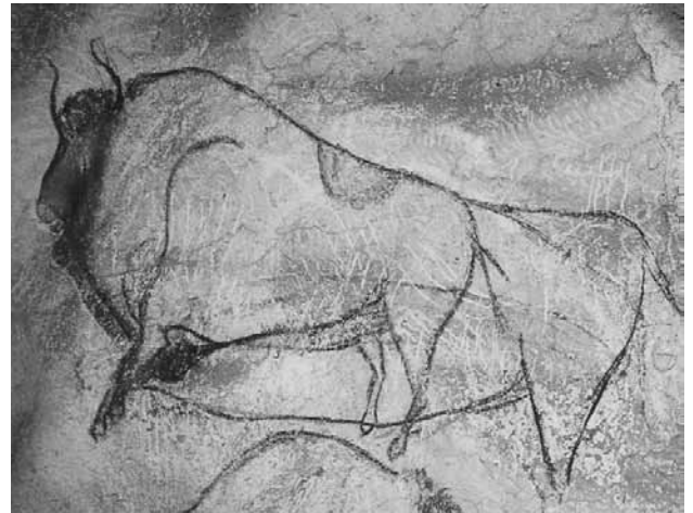
Fig. 5 a - Grotta Chauvet. Felino la cui testa è disegnata in una sequenza di quattro movimenti. (photo, J. Clottes AAVV 2001) b - Grotta Chauvet. Bisonte disegnato con più silhouette del corpo per indicare un eventuale spostamento. (photo, J. Clottes AAVV 2001)