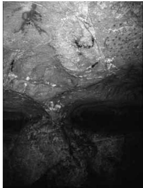
Fig. 1. a – Grotta dei Cervi. Un antropomorfo androgeno affiora sulla parete, ha la testa ovale, il busto femminile e il sesso maschile. (Anati 2004) b - Grotta dei Cervi. Una faccia con occhi e naso è alla base di alcune pitture rosse. (Leone 2009a).