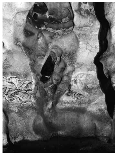
Fig. 3 a – Grotta Chauvet. Dettaglio della faccia con gli occhi di gufo e la nicchia col rinoceronte. b - Grotta Chauvet. Particolare della cavità a forma pube femminile.