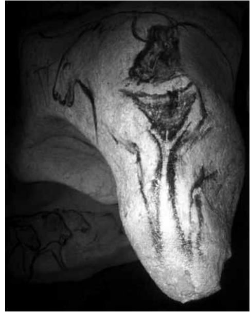
Fig. 4 a - Grotta Chauvet. Dettaglio della testa gigantesca. Oltre alla fronte, l'occhio e il naso, un pendente roccioso forma il suo mento.; b - Grotta Chauvet. Dettaglio del mento-pendente del Sorcier sul quale è dipinto un essere donna-bisonte-felino.