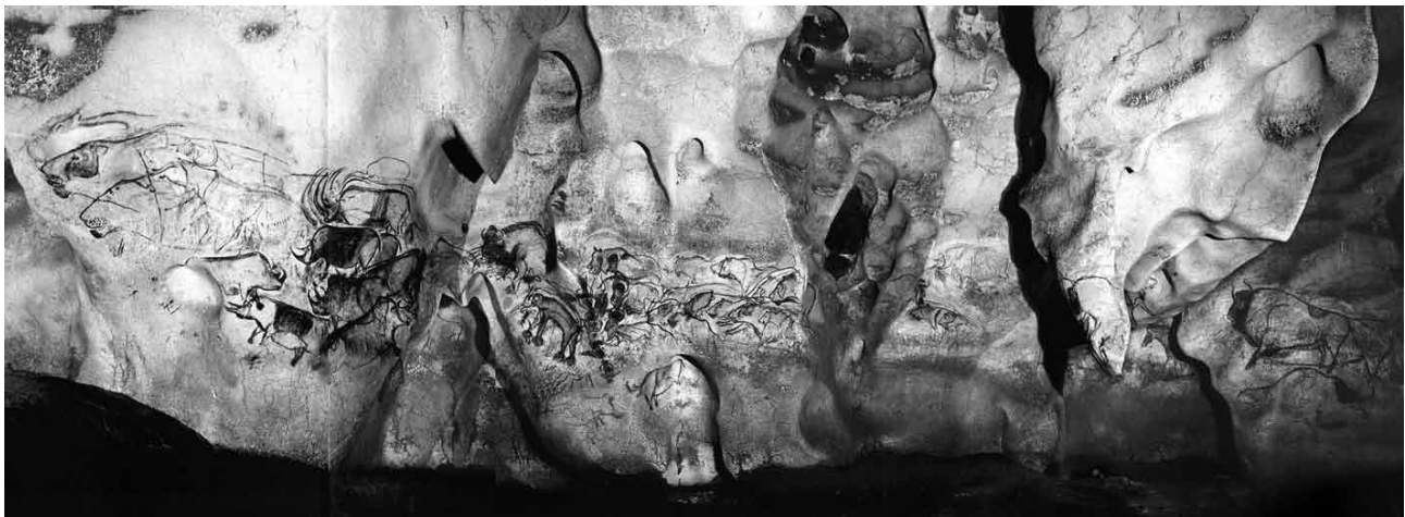
Fig. 2 – Grotta Chauvet. Panorama della parete sinistra della Sala del Fondo. Al centro la forma della roccia suggerisce un viso con occhi di gufo e una bocca (la nicchia in basso col rinoceronte). A destra c'è una rientranza simile a un pube femminile e più a destra una gigantesca faccia antropomorfa. (photo, N. Aujoulat e V. Feruglio, AAVV 2001).