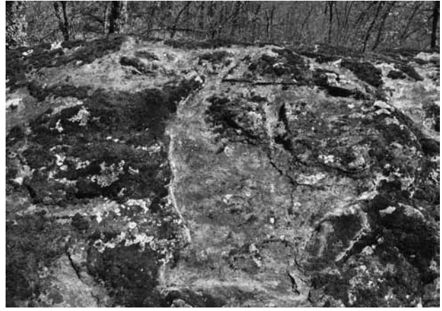
Fig. 4 Le bras avec l'arc