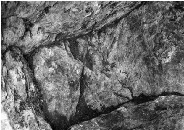
Fig. 9 Le canal pour la libation