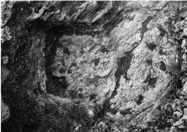
Fig. 7 La tête avec des coupoles