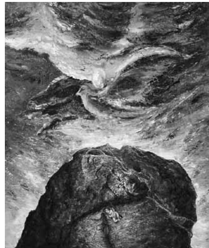
Fig. 10 Ma peinture: le rocher de Marko