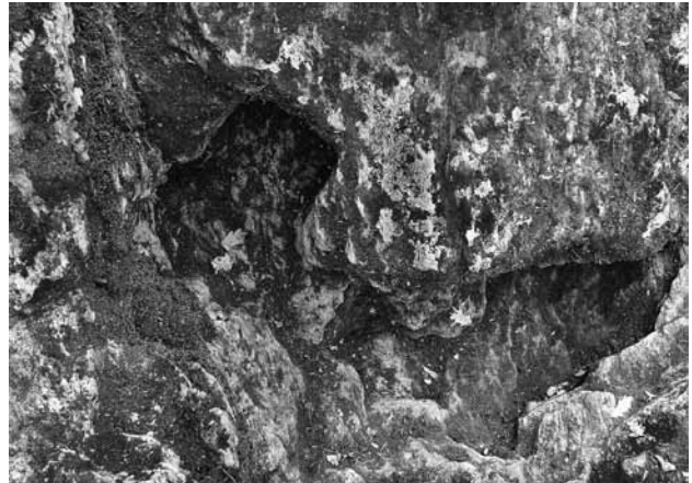
Fig. 6 Le nouveau-né