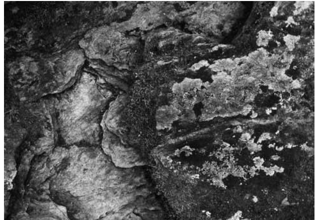
Fig. 8 L'étoile et le cordon ombilical