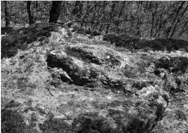
Fig. 5 La vulve: le symbole des parturientes