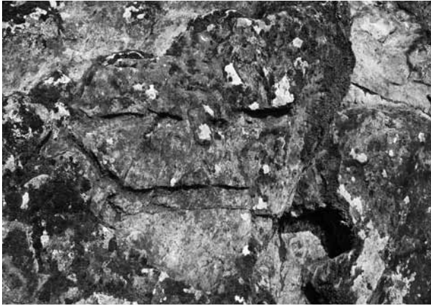
Fig. 3 Le grand esprit-protecteur