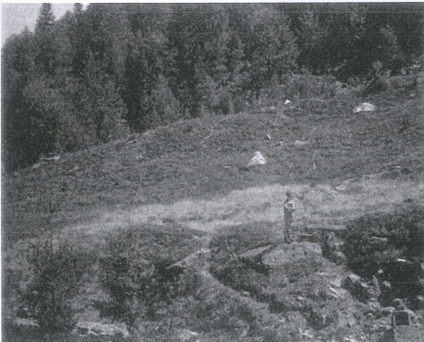
SASSO DEL FULMINE ALL'ALPE CAMPRA (1450 mt.) Orcesco (Druogno) Sul sasso sono visibili 9 coppelle, 2 vaschette, canaletti e 2 croci\ (forse segnì di esaugurazione)