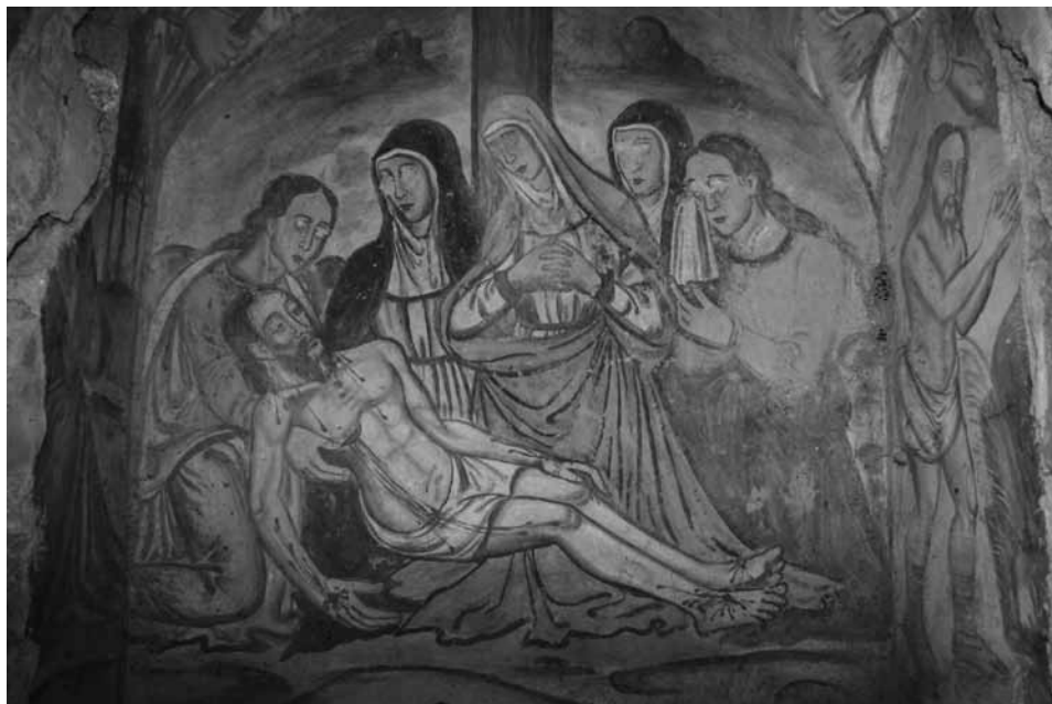
Fig. 7 - Juan de Ribera, 1565. Representación del Planto ante Cristo muerto en la capilla de la ermita de San Jorge.

acompañados de los versículos correspondientes escritos sobre cartelas en letra gótica. En la superficie del arco diafragma más próximo se conservan típicas representaciones renacentistas de putti o niños desnudos entre roleos vegetales. Todas las figuras han sufrido actos vandálicos (golpes sobre los ojos y los rostros de las figuras) que ya se documentan de antiguo.