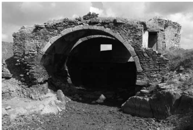
Fig. 1 - Ermita de San Jorge (Cáceres, España). Vista general de su frente meridional.