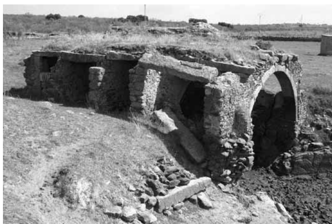
Fig. 2 - Ermita de San Jorge (Cáceres, España). Vista general de su costado occidental.