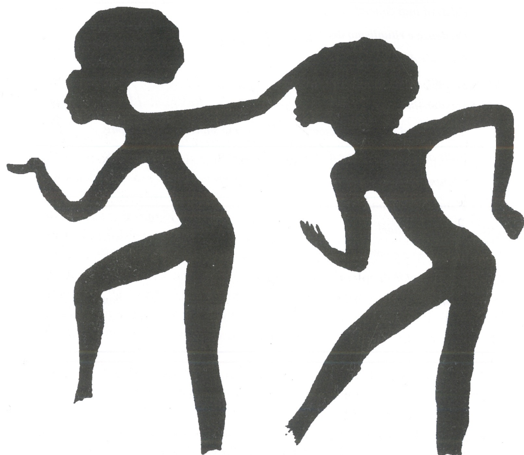
Fig. 1 Ritmo, gestualità, sintonia, cooperazione tra individui sono espressioni di una esigenza di armonia. Pitture rupestri di Cacciatori Evoluti da Wed Mertoutek, Hoggar, Algeria (da E. Anati, 1994a, p. 105).