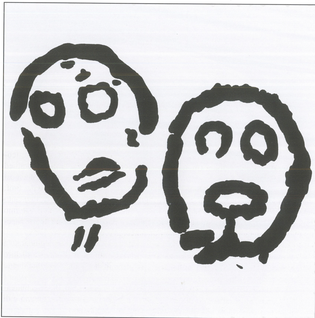
Fig. 2 Figura di "maschere". Incisioni rupestri del periodo Neolitico. Helanshan, Ningxia.